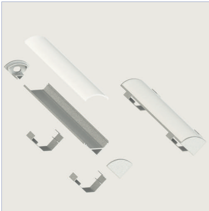
Paris - LL-0725-8