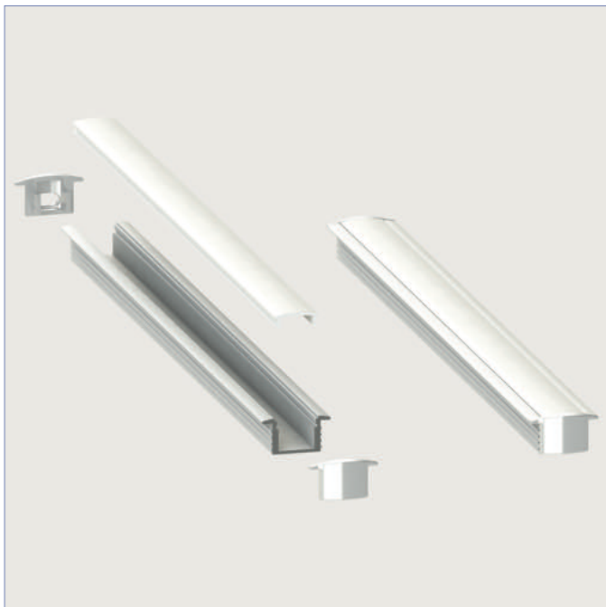
TOKYO - LL-0746-8